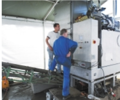
De Rofitec installatie voor het ontwateren van slib en bagger.

Bij bagger treedt vooral de kostprijs van het bewerken en storten op de voorgrond. Het storten van baggerspecie kost niet veel en elke nieuwe behandelingswijze wordt tegen die kostprijs afgezet. Eén en ander is natuurlijk ook afhankelijk van de verontreinigingen die in de baggerspecie aanwezig zijn. Zitten er alleen PAK's en olie in, dan kan met land-farming het nodige worden bereikt. Mits je daarvoor de ruimte hebt natuurlijk. Maar er zijn vanzelfsprekend ook situaties waar weinig ruimte is en waar veel bagger vrijkomt die zeer ernstig