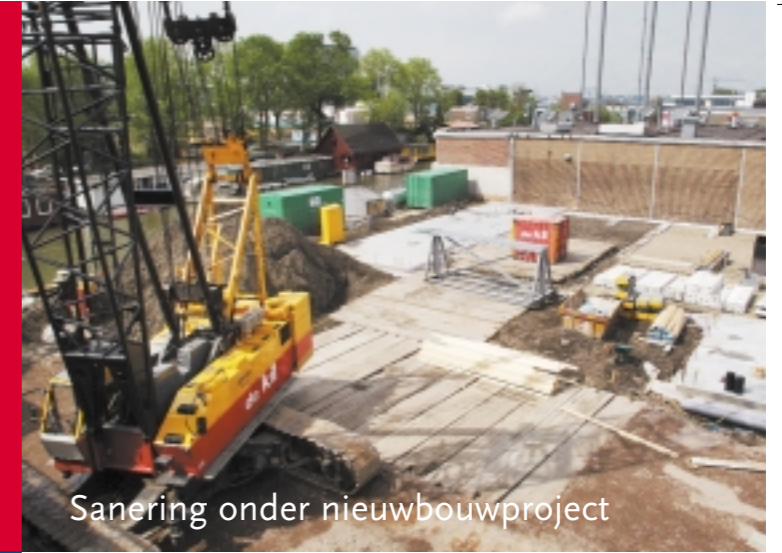
Sanering onder nieuwbouwproject

Aan de Asterweg te Amsterdam is dit voorjaar begonnen met de bouw van een nieuw kantorencomplex. Gedurende de bouw gaat BioSoil door met de sanering van de bodem op de locatie.